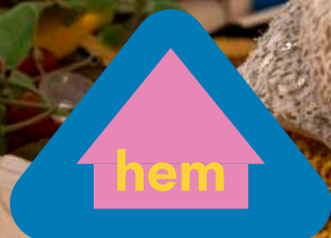
Bild: barn på förskola som HCE bedriver.

Organisationen Hope for Children in Ethiopia (HCE) hjälper familjer så de har råd med skola, och barn slipper arbeta. Barn kan få den trygghet, utbildning och meningsfulla fritid som de behöver!