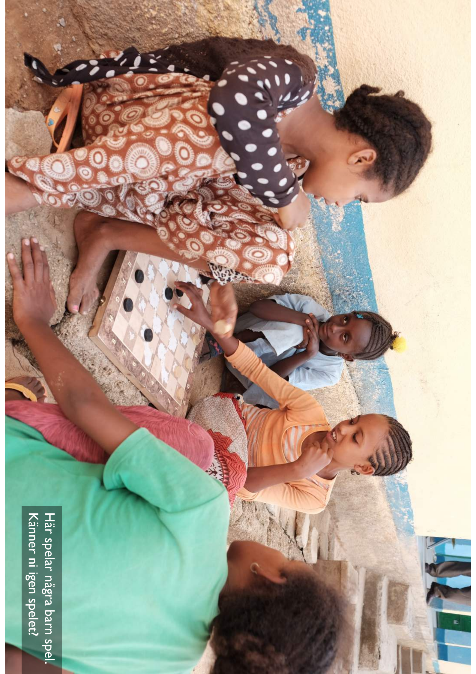
Här spelar några barn spel. Känner ni igen spelet?