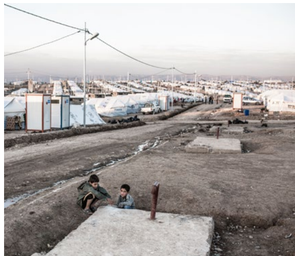
Flyktingläger i Irak.