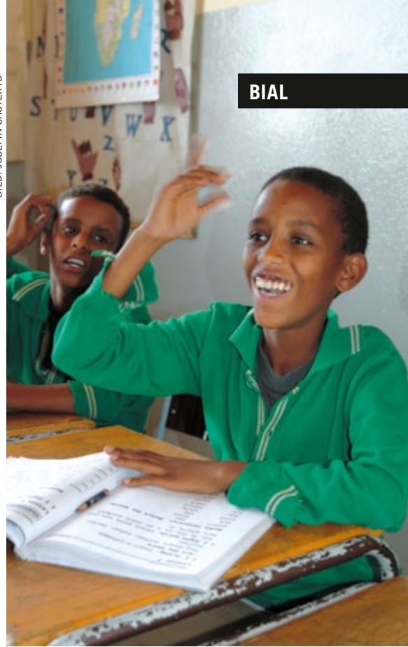
Bial ger döva barn i Eritrea möjlighet att gå i skolan. Det är ett av projekten som konfirmanderna i Åsljunga stöttade genom missionsloppet.

Stöd Barn i alla länder via bg 900-9903. Skriv "Bial" i meddelanderutan. Tack för din gåva!